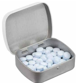
Освежающие конфеты 12466.40 Polar Express, ver. 2