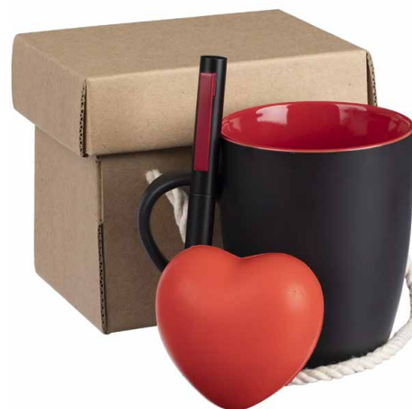
Набор Unwind, красный Цена 968 руб.