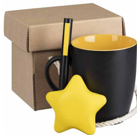
Набор Unwind, желтый Цена 972 руб.