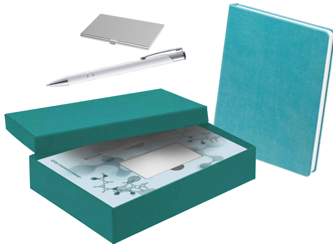
Пример реализованного набора