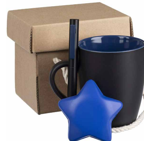
Набор Unwind, синий Цена 972 руб.