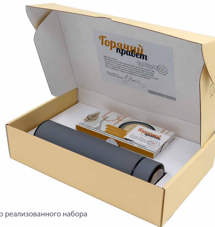
Пример реализованного набора