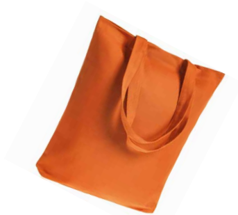
Холщовая сумка 11293.20 Avoska

Материал: хлопок 100%, плотность 220 г/м 2 ; саржа Размеры: 35x38x5 см, ручки: 54x2,5 см