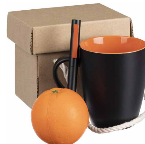
Набор Unwind, оранжевый Цена 1022 руб.