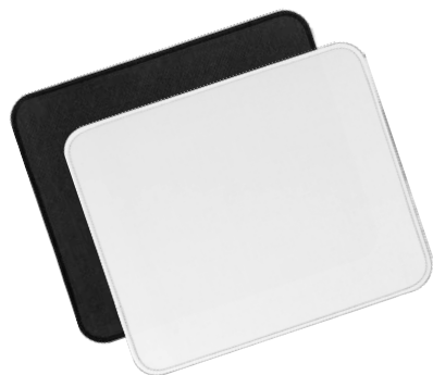
Коврик для мыши 20124.30 Paddo L

Материал: полиэстер, вспененная резина Размер: 25x30x0,3 см