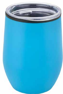
Термокружка 5044.088 Top

Материал: Внутри - пластик, снаружи - нержавеющая сталь Размеры: 8.9x8.9x12.1 см, 350 мл.