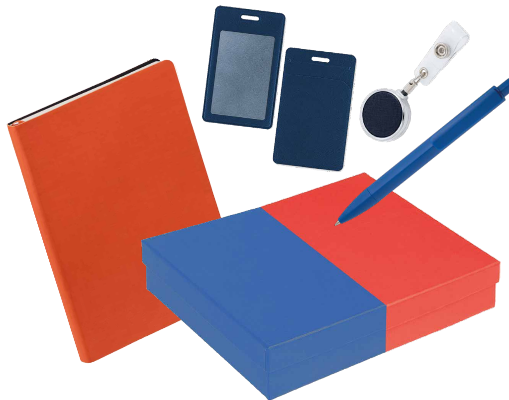
Пример реализованного набора

Welcome pack (или приветственный набор) — это тщательно продуманный комплект предметов, который компания дарит новым сотрудникам в первые дни работы. По сути, это материальное воплощение вашего "Добро пожаловать в команду!", которое можно не только услышать, но и увидеть и потрогать.